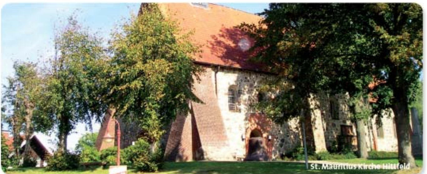
St. Mauritius Kirche Hittfeld