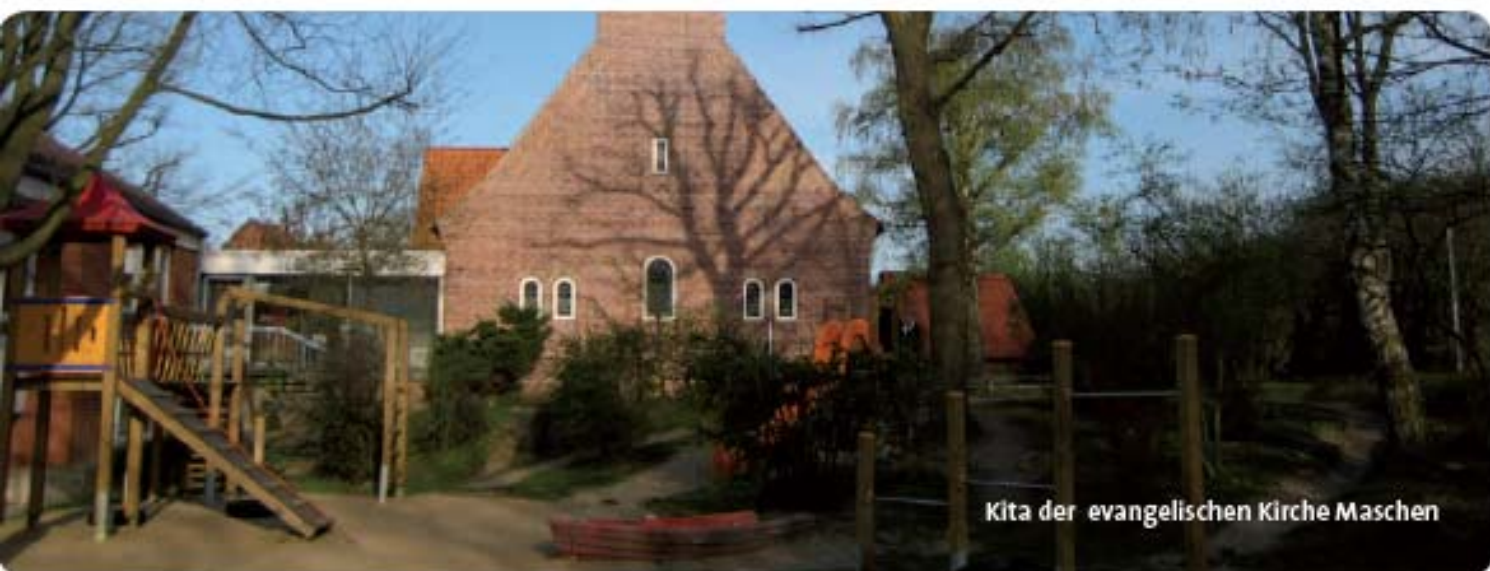
Kita der evangelischen Kirche Maschen