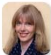
Frandska Henning Listenplatz 8