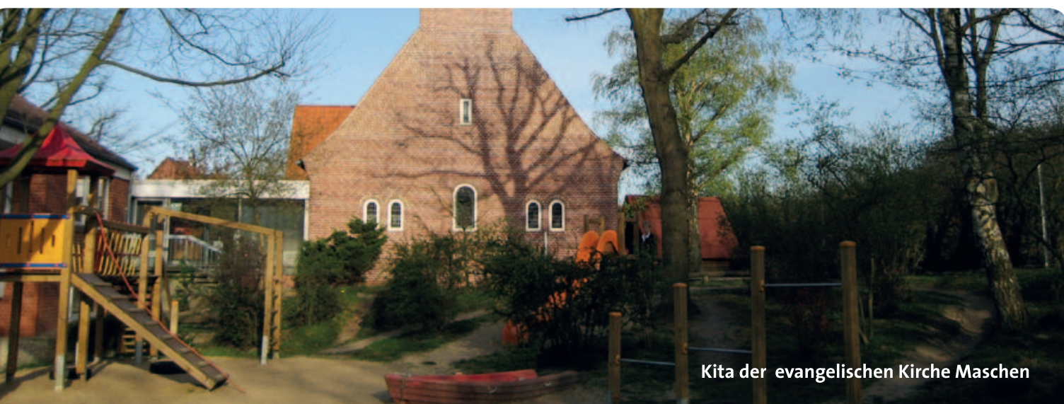
Kita der evangelischen Kirche Maschen