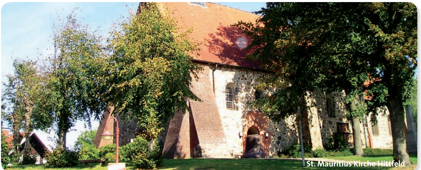
St. Mauritius Kirche Hittfeld